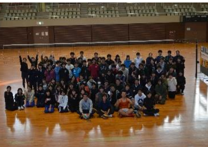
最後は皆でハイピース！