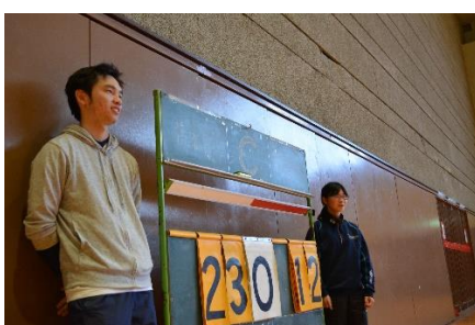
試合進行も自分たちの手で！