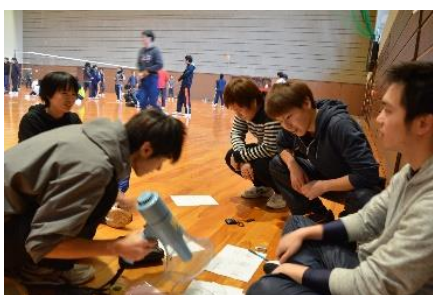
学友会お疲れ様です！