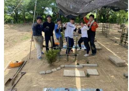
造園技能士3級 実技試験終了時にて