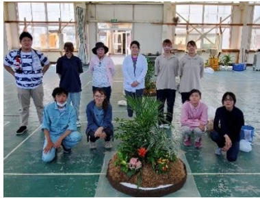
園芸装飾技能士3級 実技試験終了時にて

2021年7月27日(火)に園芸装飾、7月30日(金)にフラワー装飾、8月6日(金)に造園技能士3級の実技試験が大分職業訓練センターで実施されました(フラワー装飾は短大で実施)。受験する学生らは、試験当日までに何度も練習を行いました。試験の合否は8月27日(金)に発表されます。各技能士の3級に合格した学生は、次年度に2級を受験することができます。ぜひ受験を検討してみてください。