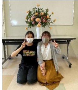
フラワー装飾技能士 来年の2級の試験に向けての練習です