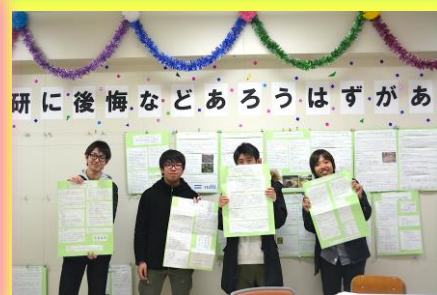
2年間頑張った園芸研究(卒業研究)のポスター