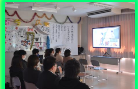
2年間の思い出の卒業DVDを鑑賞