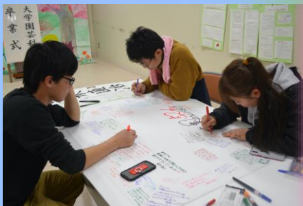
寄せ書きコーナー