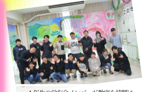
1年生の学生会メンバーが教室を綺麗に彩ってくれました。