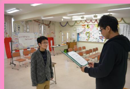
ゼミ教員による卒業証書・学位記の代理での授与