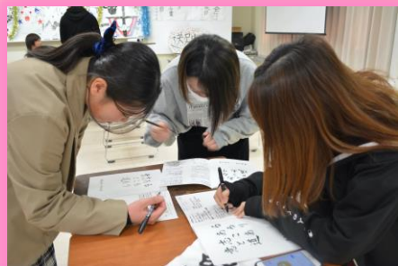
卒業アルバムに寄せ書き